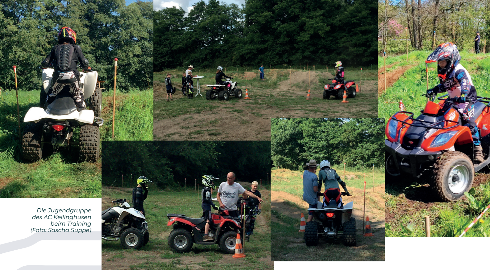
Die Jugendgruppe des AC Kellinghusen beim Training

Dieser QR-Code führt zu unserem WhatsApp Kanal