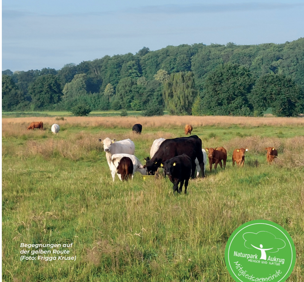
Begegnungen auf der gelben Route

Mehr Informationen zum Arbeitskreis unter www.gnk-kellinghusen.de