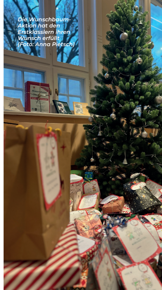
Die Wunschbaum-Aktion hat den Erstklässlern ihren Wunsch erfüllt

Sendet uns bis zum 2. April Euren Favoriten an info@kellinghusen.de , Stichwort „Stadtmagazin Name“ oder gebt ihn auch gerne schriftlich im historischen Rathaus ab.