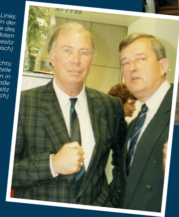
Rechts: Die Geschäftsstelle des Stör-Boten in der Hauptstraße